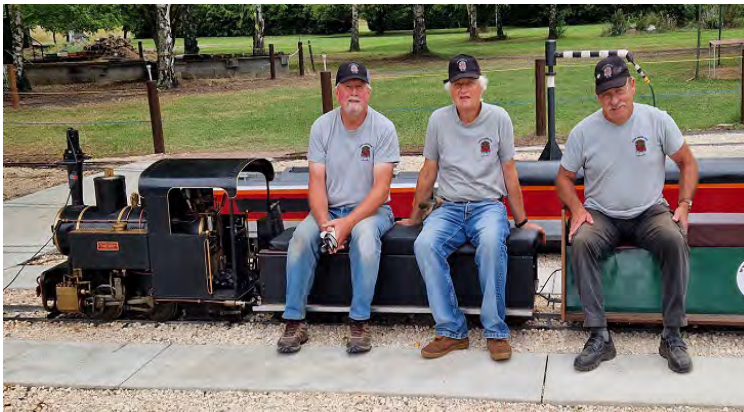
Une partie de nos amis de Séné Rail Miniature qui étaient venus en nombre avec leur loco

Le lundi 14 et le mardi 15 août nous avons conservé une quarantaine de membres et amis ainsi que 3 locomotives en 5" et 11 en 7-1/4". Les voyageurs furent moins nombreux que le dimanche, mais nous avons néanmoins fait de beaux trains bien chargés.